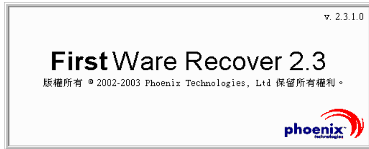
圖 2-2. FirstWare Recover 螢幕