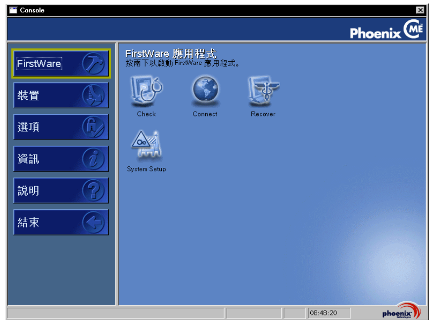
圖 2-1. Phoenix cME Console 螢幕