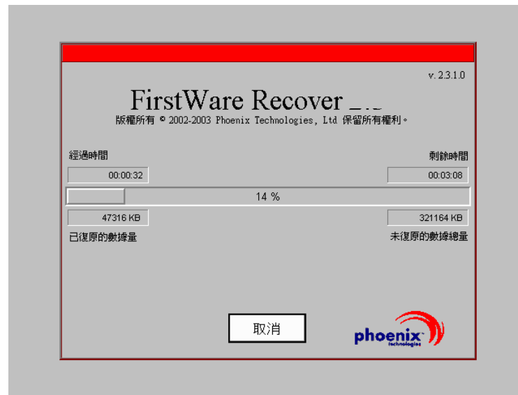
圖 2-5. FirstWare Recover 進度螢幕

當 FirstWare Recover 進度螢幕在顯示和更新時，您可以檢視復原進度。