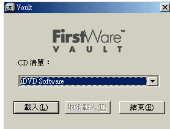
圖 2-1 FirstWare Vault 螢幕