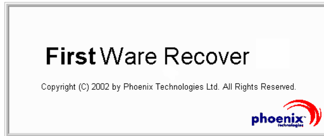
Figure 2-2. Écran fugitif FirstWare Recover

L'écran fugitif FirstWare Recover s'affiche.