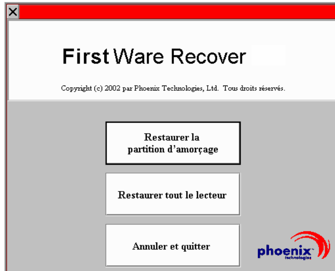
Figure 2-3. Écran Sélectionner le type de restauration

L'écran Sélectionner le type de restauration s'affiche.