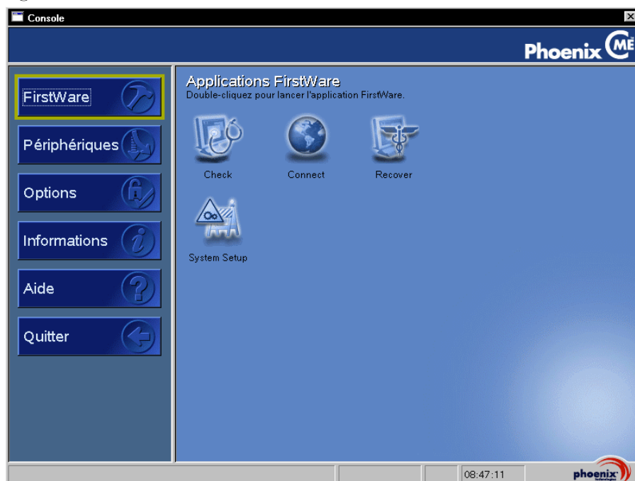
Figure 2-1. Écran Phoenix cME Console