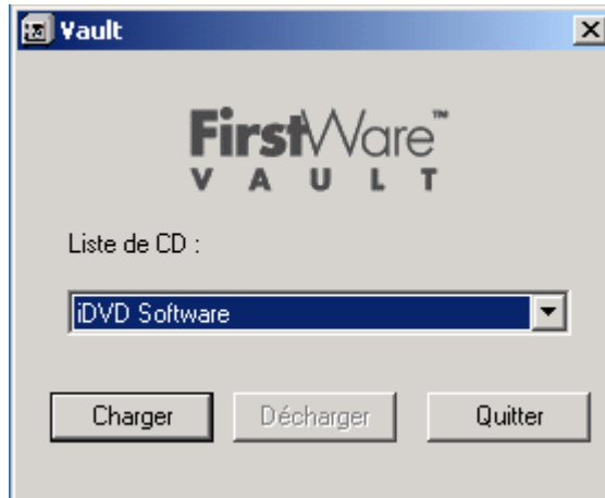
Figure 2-1 Écran FirstWare Vault