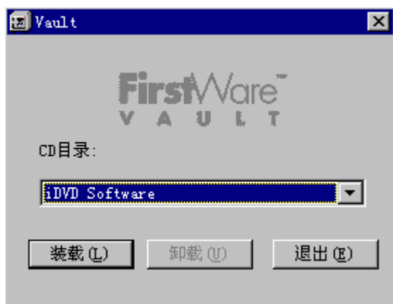
图 2-1 FirstWare Vault 屏幕