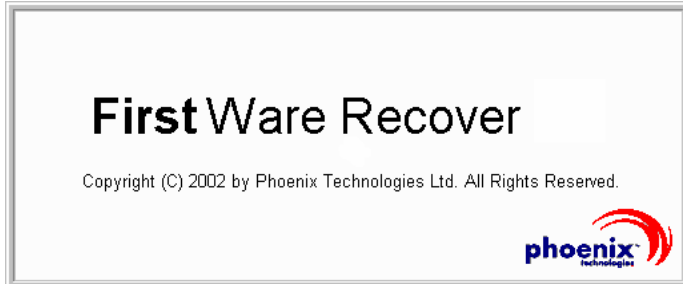
그림 2-2. FirstWare Recover 스플래시 화면