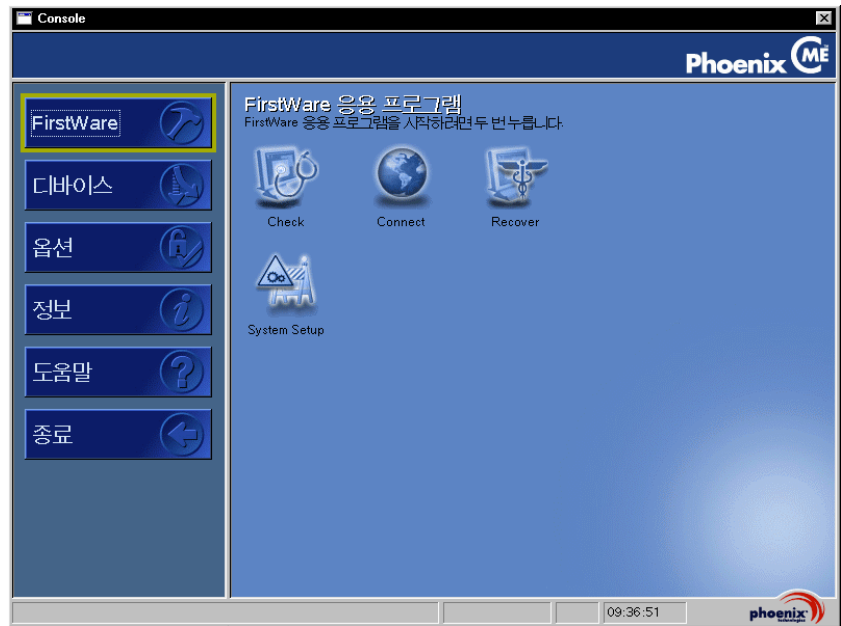
그림 2-1. Phoenix cME Console 화면