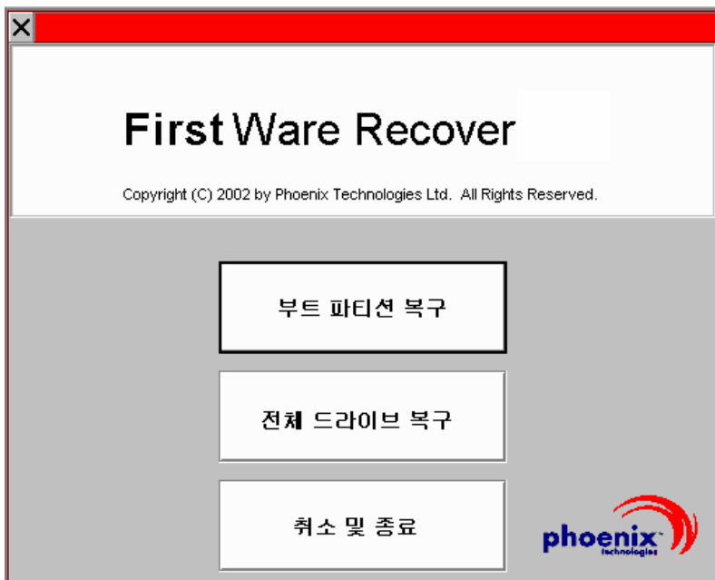
그림 2-3. 복구 유형 선택 화면