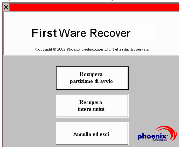
Figura 2-3. Schermo Select Recover Type

Viene presentato lo schermo Select Recover Type.