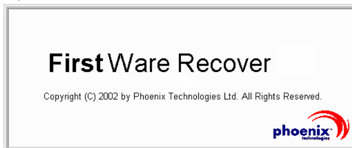
Figura 2-2. Schermo iniziale di FirstWare Recover

Viene presentato lo schermo iniziale di FirstWare Recover.