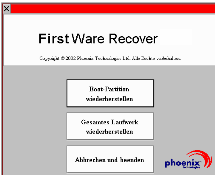
Abbildung 2-3. Anzeige zur Auswahl der Wiederherstellung

Die Anzeige zur Auswahl der Wiederherstellung wird geöffnet.