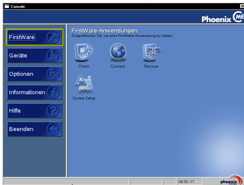
Abbildung 2-1. Phoenix cME Console-Anzeige

Die Phoenix cME Console-Anzeige wird eingeblendet.