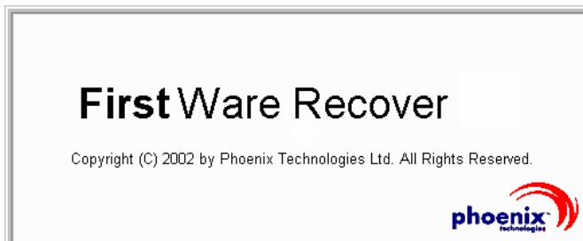
Abbildung 2-2. FirstWare Recover-Begrüßungsbildschirm

Der FirstWare Recover-Begrüßungsbildschirm wird angezeigt.