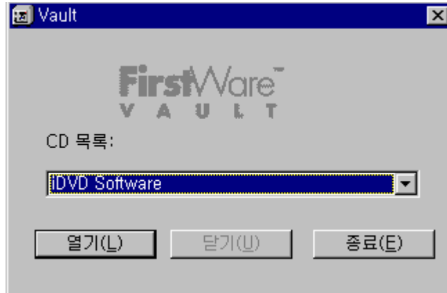
그림 2-1 FirstWare Vault 화면